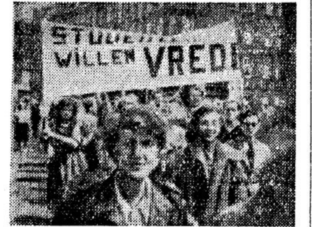
Демонстрация голландской молодежи в защиту мира. На плакате надпись: «Студенты хотят мира». Снимок из голландской газеты «Де Ваархейд».

ГОЛЛАНДИЯ. Пастор Осенбург — активный борщик за мир. На многочисленных собраниях сторонников мира он выступает с речами, разоблачающими поджигателей войны. «Для человечества», — заявил он недавно в Гааге, — единственный лекарством, которое может его спасти от гибели, является мир. Импералисты и лю-