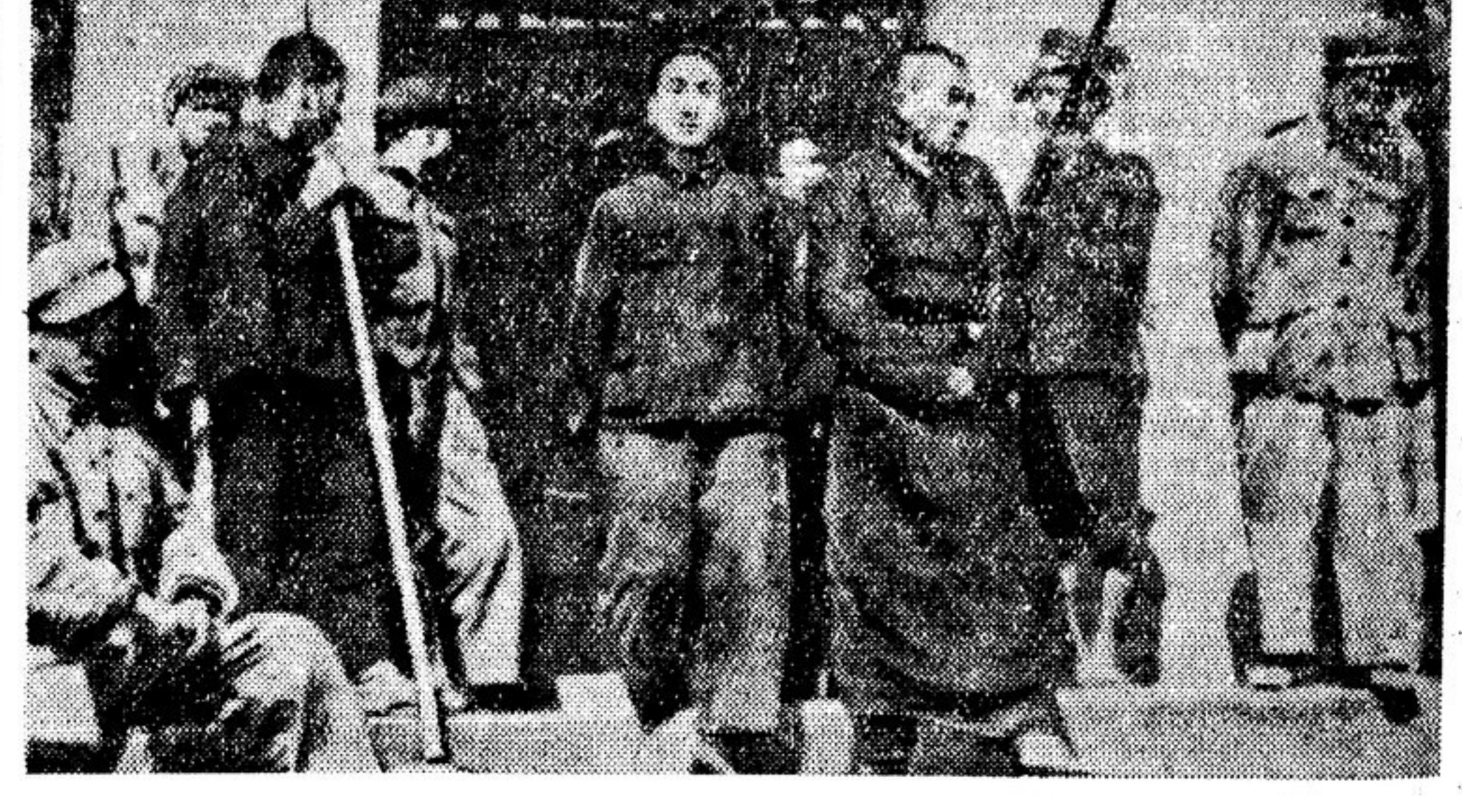
В ходе осуществления аграрной реформы в Китае народные суды разбирают дела помещиков, кулаков, контрреволюционных элементов, которые раньше жестоко эксплуатировали и угнетали бедняков, а ныне производят справедливому распределению земли. НА ФОТО — два помещика, приведенные на крестьянское собрание; они будут держать ответ за притеснения, которым подвергали крестьян при гоминдановском режиме.