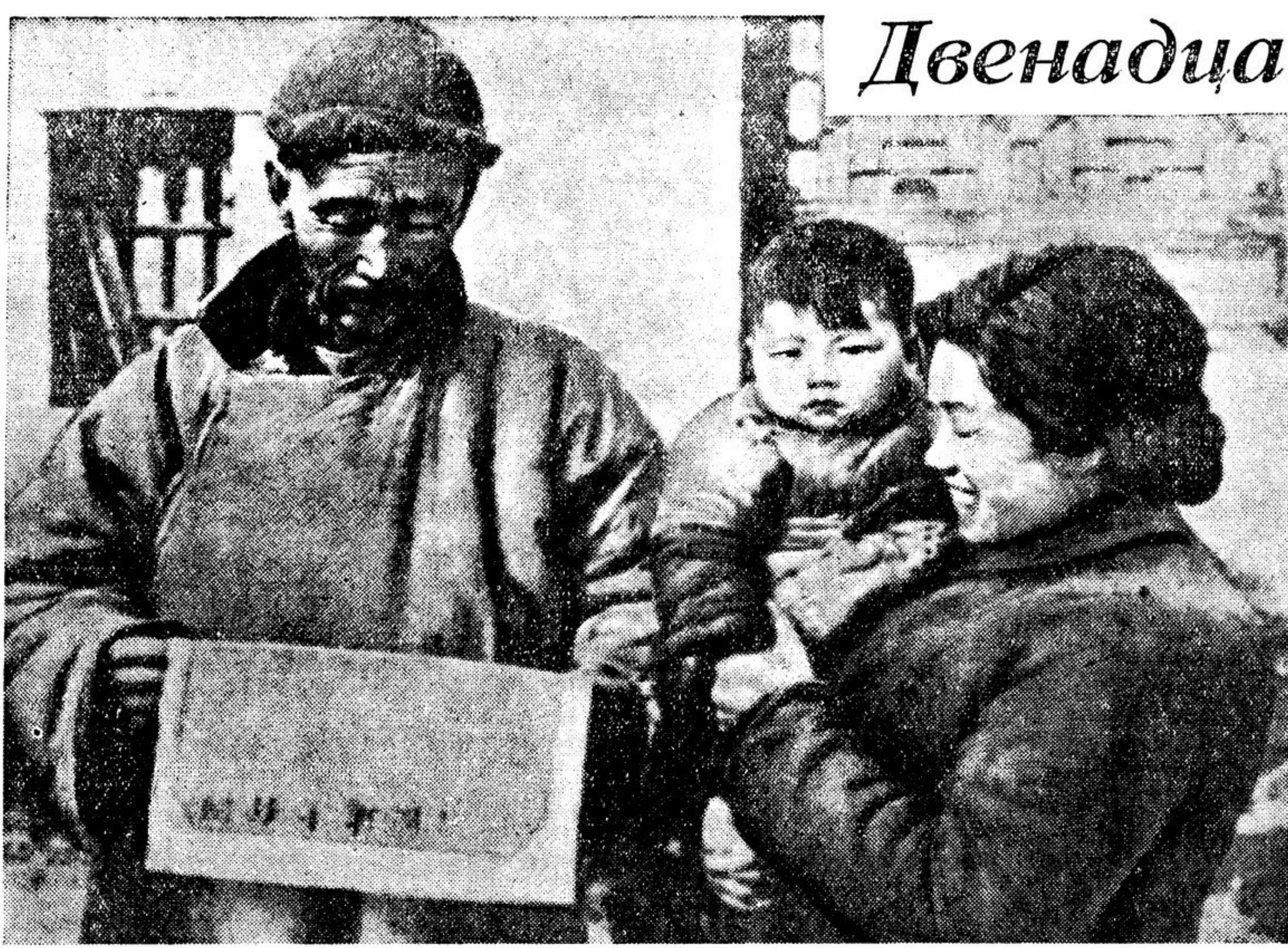
Вот он, бесценный документ, удостоверяющий, что бедный земледелец, годами гнувший спину на помещичьей каторге, теперь сделался хозяином своей земли! Давняя мечта стала явью. Как величайшую драгоценность, держит китайский крестьянин этот лист бумаги. Земельный надел ему дала народная власть.

В городе Гулетт в течение одного часа под Обращением подписали 761 человек. 60-летний старик, ставя свою подпись, сказал: «Я 20 лет служил в армии и теперь хочу уберечь своего сына от войны.»